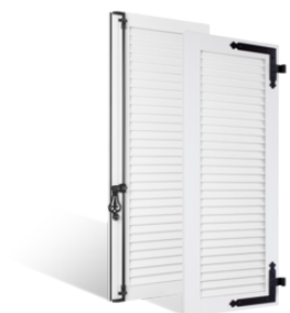
VOLETS BATTANTS 36mm à LAMES JOINTIVES en PVC EN SAVOIR PLUS