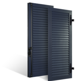
VOLETS BATTANTS 33mm à LAMES JOINTIVES en ALUMINIUM EN SAVOIR PLUS