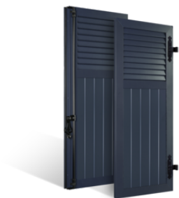
VOLETS BATTANTS 33mm à LAMES JOINTIVES AU TIERS en ALUMINIUM EN SAVOIR PLUS