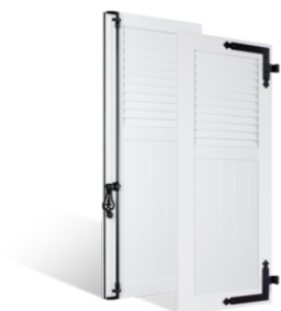
VOLETS BATTANTS 36mm à LAMES JOINTIVES AU TIERS en PVC EN SAVOIR PLUS