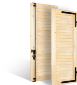
VOLETS BATTANTS 32mm à LAMES JOINTIVES en BOIS EN SAVOIR PLUS